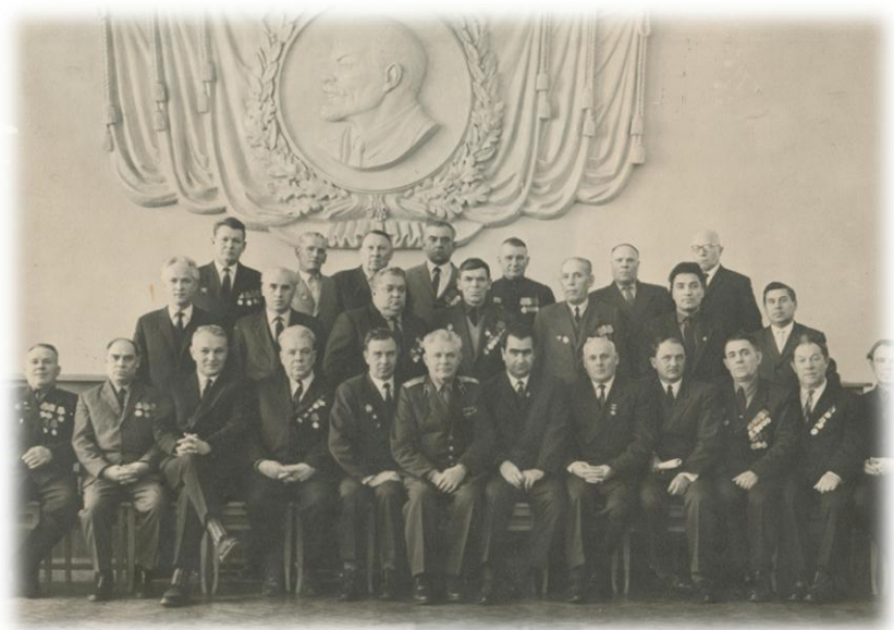
Группа освободителей г Шахты