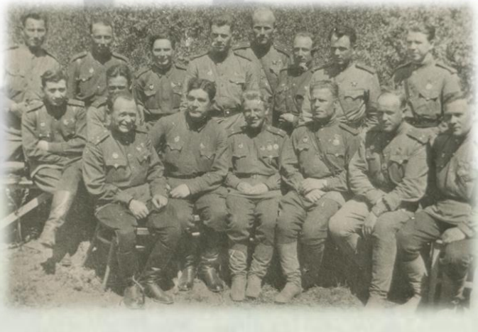
Командирский состав 40 гвардии стрелковой дивизии

Похоронен на Аллее почётного захоронения в Баку.